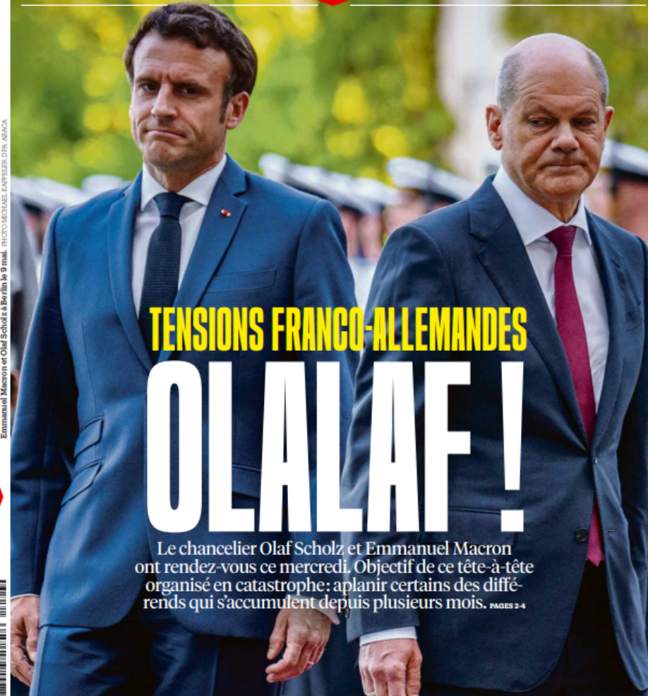
Emmanuel Macron et Olaf Scholz à Berlin le 9 mai.

«BOWLING SATURNE» «Montrer à l'écran la violence dans ce qu'elle a d'insoutenable» ET TOUTES LES SORTIES CINÉ, PAGES 22-27